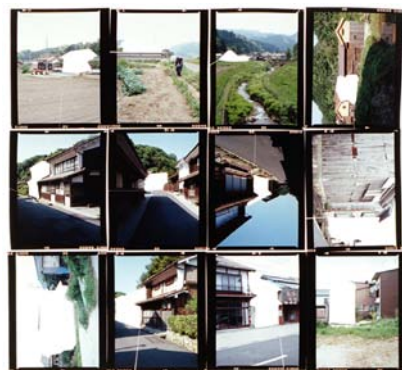
Akira Somekawa Japon