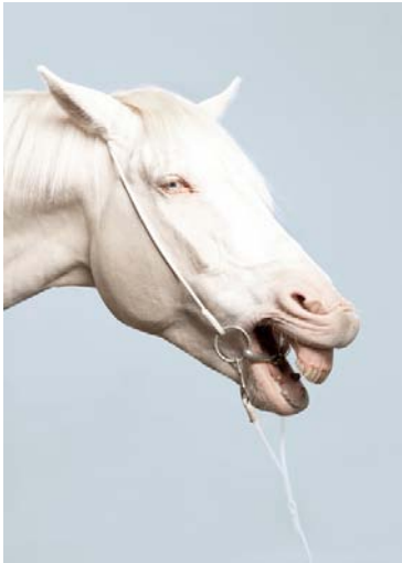
Olga Cafiero Suisse/Italie