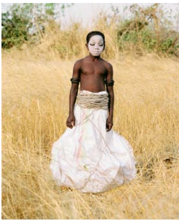
Namsa Leuba Suisse